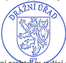
Ing. Jarmila Wagnerová ředitelka územního odboru Olomouc

Proti tomuto rozhodnutí může účastník řízení podat odvolání, podle § 81 odst. 1 správního řádu, ve lhůtě 15 dnů ode dne jeho oznámení k Ministerstvu dopravy České republiky, podáním učiněným u Drážního úřadu, sekce infrastruktury, územní odbor Olomouc, Nerudova 1, 779 00 Olomouc. Odvolání jen proti odůvodnění rozhodnutí je podle § 82 odst. 1 správního řádu nepřípustné . Odvolání se podává s potřebným počtem vyhotovení tak, aby jeden stejnopis zůstal správnímu orgánu, a aby každý účastník dostal jeden stejnopis. Nepodá-li účastník potřebný počet stejnopisů, vyhotoví je Drážní úřad na náklady účastníka.